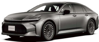
●CROWN 35 系 (セダン)

走行中に HDC7 で入力された映像を視聴するには別途 TV コントローラー (ビートソニック製品 CB7429A) が必要となります