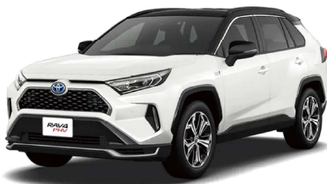
● RAV4/RAV4 PHEV

第1世代ディスプレイオーディオ用外部入力キット「AVX シリーズ」は使用できません！