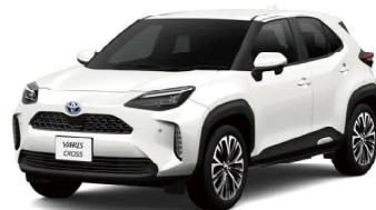
● YARIS CROSS